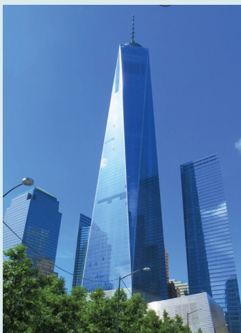
New World Trade Center

Jeśli jesteś zaciekawiony tym, co jeszcze kryje Nowy Jork, i czujesz lekki niedosyt, to zostań... dzień dłużej. Odwiedź Frick Collection , by pogłębić wiedzę na temat malarstwa (s. 138), a popołudnie spędź w Muzeum Historii Naturalnej (s. 143). Jeżeli wolisz aktywniejszy odpocznik, zamień wizytę w jednym z tych muzeów na długi spacer po Riverside Park (s. 147) lub zakupy w Soho (s. 84). Na kolację wybierz się do barwnego miejsca pełnego zapracowanych ludzi i pachnącego Azją – Koreatown lub Chinatown (s. 78).