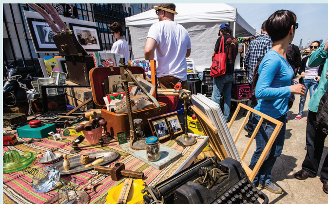
Pchli targ w Brooklynie

Przenieś się myślami w czasy średniowiecza. Ogród Museum Cloisters to oaza spokoju, położona pomiędzy rzeką Hudson i kamiennymi murami klasztorów, które założyli Europejczycy (zob. s. 150).